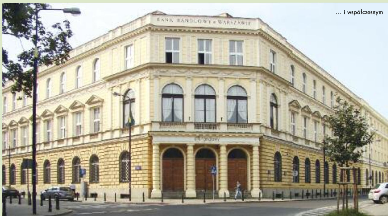
... i współczesnym