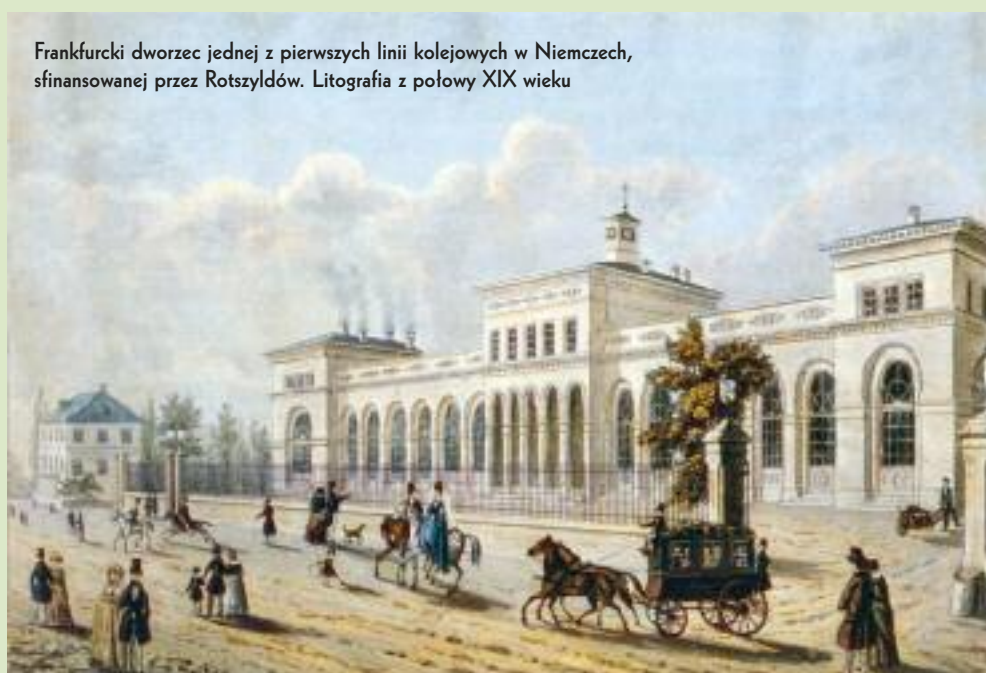
Frankfurcki dworzec jednej z pierwszych linii kolejowych w Niemczech, sfinansowanej przez Rotszyldów. Litografia z połowy XIX wieku

stała się stagnacja w procesie kreowania nowych banków i dopiero przełom stuleci przyniósł wyraźny postęp w tej dziedzinie. W latach 1893 – 1913 powstało siedem nowych banków akcyjnych, spośród których wypada wyróżnić założone w 1910 roku banki hipoteczne – Ziemiński Bank Kredytowy SA we Lwowie oraz reprezentujący kapitał ukraiński i nastawiony na obsługę kredytową ukraińskich chłopów Ziemiński Hipoteczny Bank SA we Lwowie. Kredytu hipotecznego udzielał również w zaborze austriackim utworzony w 1841 roku we Lwowie