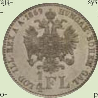
Ćwierć guldena austro-węgierskiego z 1869 roku

O dbył się on w nieco innych warunkach niż w zaborze pruskim i rosyjskim. Oprócz czynników zewnętrznych wpływających na życie gospodarcze determinowały go skromne zasoby kapitału, wręcz ubóstwo dużej części potencjalnych klientów systemu kredytowego, a także zróżnicowana struktura narodowościowa. Przede wszystkim jednak należy podkreślić