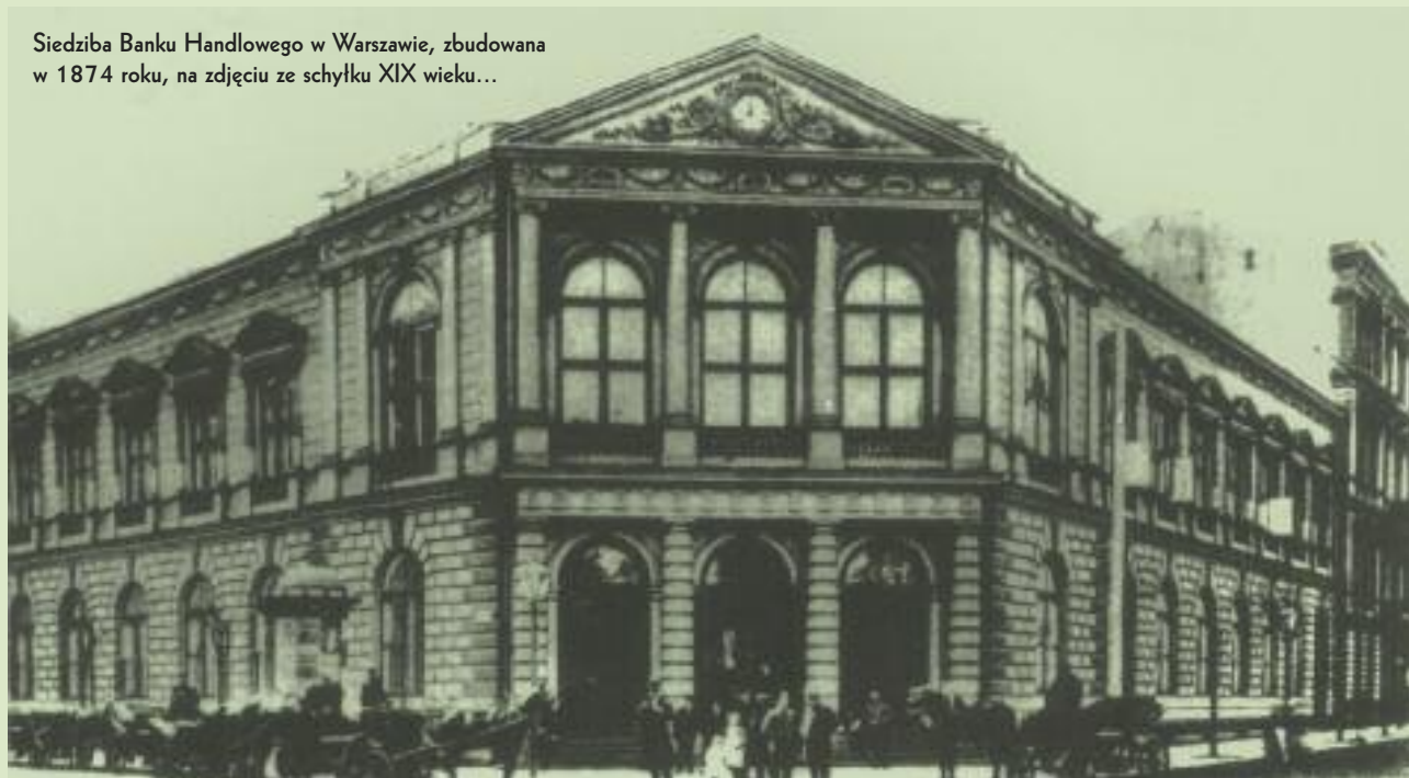
Siedziba Banku Handlowego w Warszawie, zbudowana w 1874 roku, na zdjęciu ze schyłku XIX wieku...