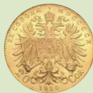
Złota moneta 20-koronowa z 1910 roku

W 1862 roku we Lwowie działały 84 takie placówki, a w Krakowie było ich 44. Pierwsza – Dom Bankowy Natansohn i Kallir – powstała w latach