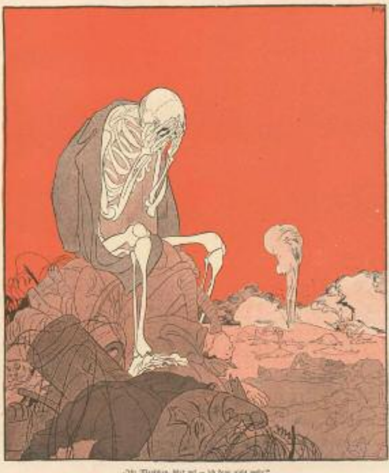
Der Tod von Flandern