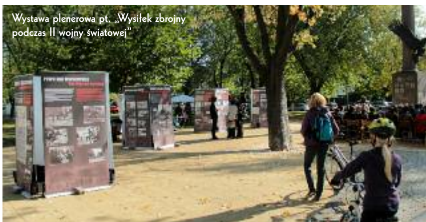
Wystawa plenerowa pt. „Wysilek zbrojny podczas II wojny światowej”

Projekt ma charakter otwarty. Oprócz zaproszonych gości udział we wszystkich wymienionych imprezach mogą wziąć osoby lub instytucje zainteresowane tematem. Zapraszamy. □