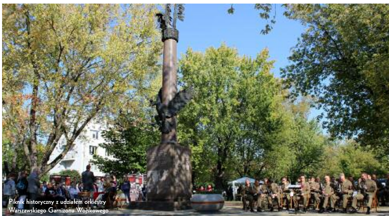
Piknik historyczny z udziałem orkiestry Warszawskiego Garnizonu Wojskowego

Drogą do zrozumienia jest m.in. edukacja. Nauczyciele warszawskiego CXIV Liceum Ogólnokształcącego im. Jana Kilińskiego stworzyli ambitny pro-